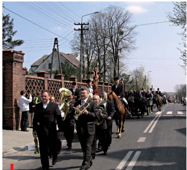
Orkiestra na czele